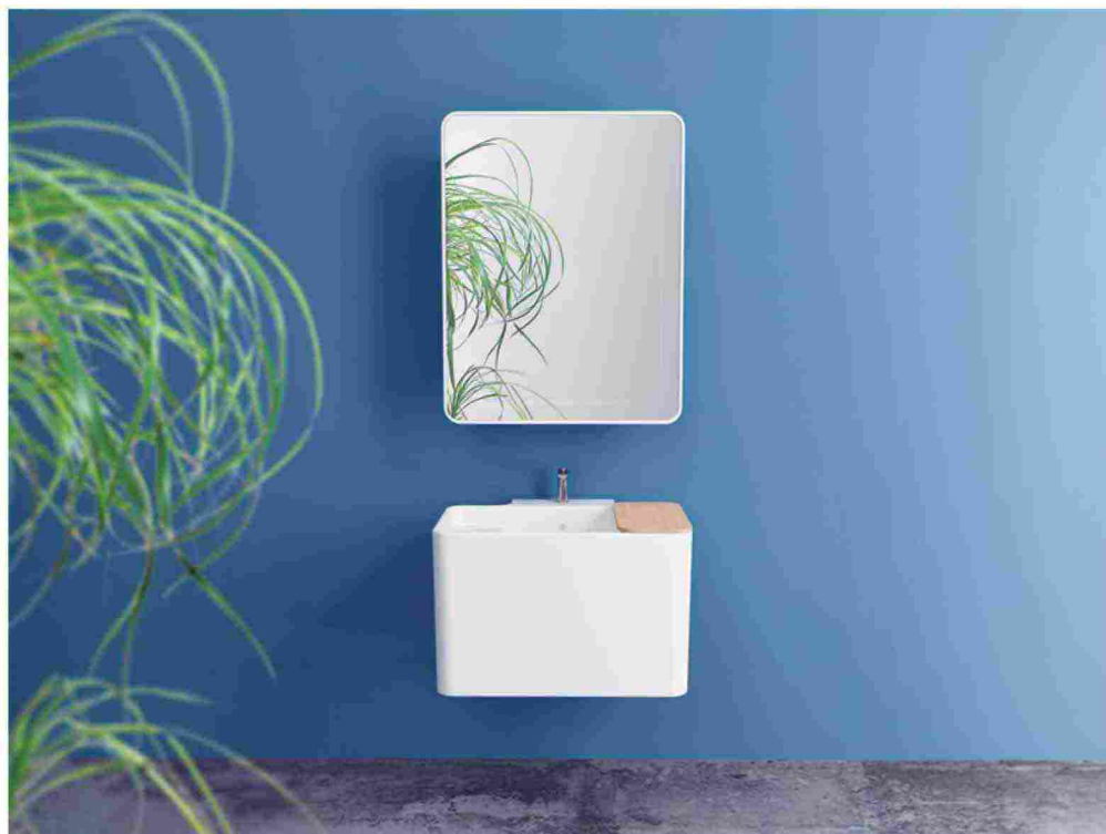
Nelle immagini, il lavabo Anfibia, disegnato da Matteo Ragni e prodotto da Azzurra Ceramica