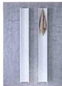
Antrax IT Serie T, design Matteo Thun e Antonio Rodriguez. Non solo termosifone, ma elemento d'arredo: messo orizzontale è una mensola, in verticale diventa portasciugamani. Di alluminio estruso