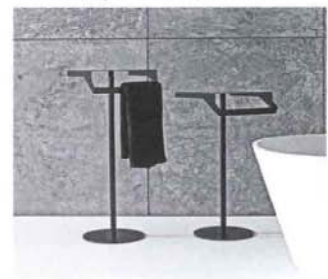
Antoniolupi Della linea accessori: Gino, design Daniel Debiassi e Federico Sandri. Un tavolino-porta asciugamani realizzato con fogli di metallo piegato. In nero opaco o bianco