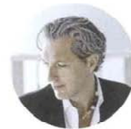
Marcel Wanders Dopo i mosaici, il designer olandese torna a collaborare con Bisazza e firma una collezione pop-barocca ispirata alla forma della saponetta

Boffi Pianura, design Monica Armani. «Punta sull'uso innovativo della luce abbinata al top per dare carattere al prodotto». Così l'ad Roberto Gavazzi descrive il programma di mobili ed elementi bagno in finitura legno o laccato opaco con ripiani in metallo verniciato e ante di forte spessore. Abbinati agli accessori Skyline di neunzig° design. Sono tra i prodotti selezionati dall'azienda per il prossimo progetto di sviluppo in Asia. Dopo Giacarta e Tokyo, le prossime aperture sono in Cina, Malesia e India.